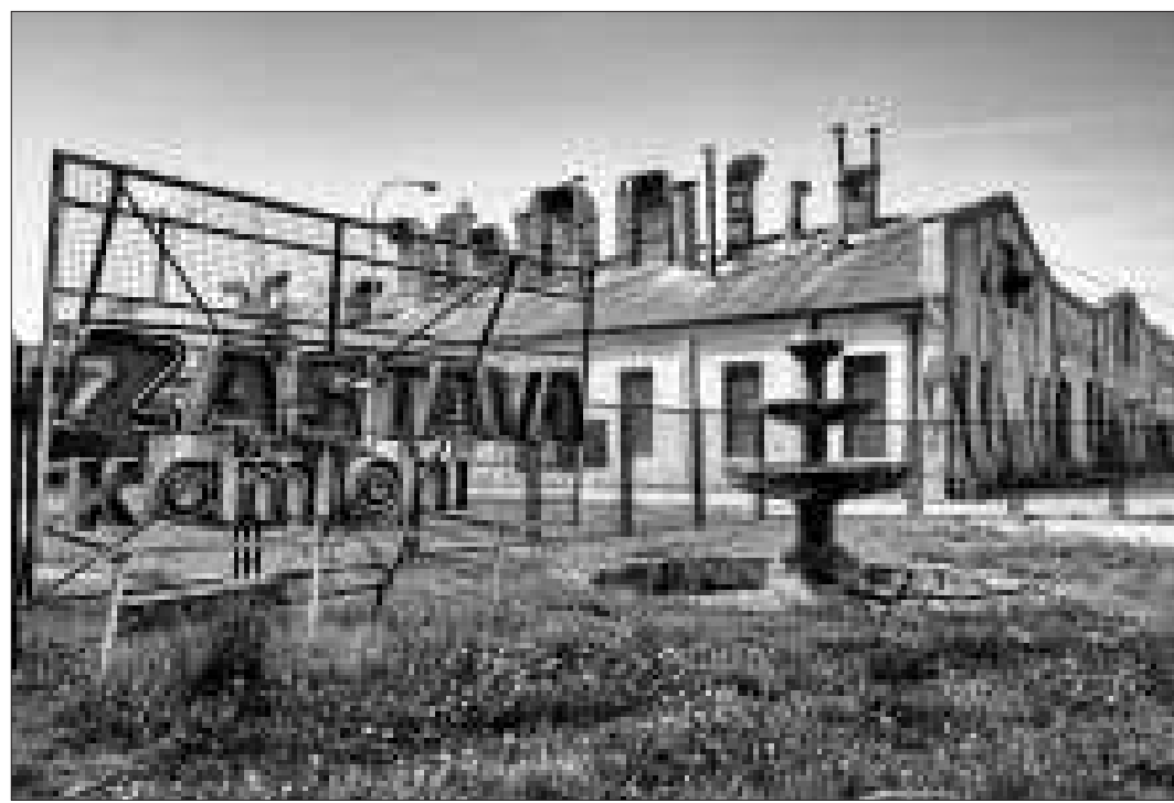
Hubert Klotz' Fotoreportage über Kragujevac ist größtenteils in Schwarz-Weiß gehalten.

Klotz' Herangehensweise an die Aufgabe Kragujevac war eine andere. Er selbst spricht von einem „melancholischen, nostalgischen Blick“, den er auf die einstige serbische Hauptstadt angewandt habe. Während sich Mihajlovic bewusst